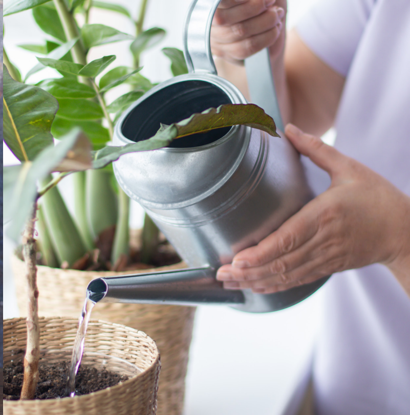
Bescherm de bodem en wortels van je planten